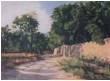
رنگ روغن، ۶۰×۸۰، ۱۳۹۳