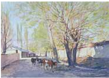
آبرنگ، ۲۹×۳۹، ۱۳۷۱