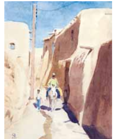
آبرنگ، ۳۶×۲۷، ۱۳۹۲

موضوع و حس شگفت‌انگیزش از جوهر و باطن نقاشی واقع‌گرا - بی‌آنکه اسیر واقعیت محض باشد - خود نیاز به مجال مفصل‌تری دارد، ولی همین قدر کفایت می‌کند که او را مهم‌ترین نقاش واقع‌گرای ایرانی این دوران می‌دانم و شادمان و مفتخرم که سال‌هایی چند در دانشکده هنرهای زیبا دانشگاه تهران انیس و جلیس او بوده‌ام.