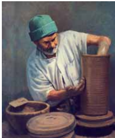
رنگ روغن، ۷۵×۶۵، ۱۳۹۳