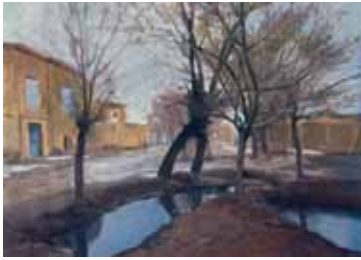
رنگ روغن، ۴۵×۶۰، ۱۳۹۲