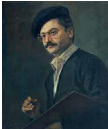
چهره هنرمند، رنگ روغن، ۵۷×۷۰، ۱۳۶۷